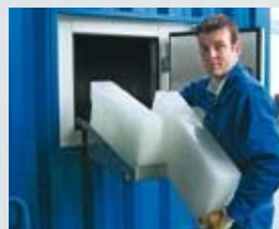
Container en ijsblokken